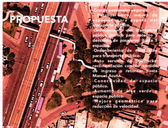
Imágenes de Diagnóstico y propuestas conceptuales