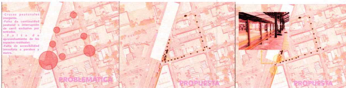
Imágenes de Diagnóstico y propuestas conceptuales Lerdo de Tejada

Otro punto que se realizó propuesta conceptual fue en la calle Lerdo de Tejada en donde el diagnostico realizado nos reflejo la siguiente problemática: