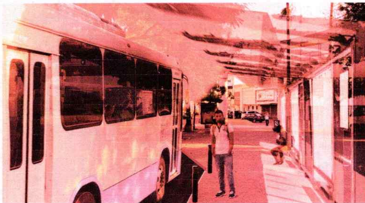
Imagen de fotomontaje de parada Sor Juana Inés de la Cruz

La calle Sor Juana Inés de la Cruz con Av. Universidad es una de los puntos con mas alta demanda de usuarios de transporte publico, al hacer un diagnostico por medio de visitas al sitio, información cuantitativa de pasajeros que nos facilito INPLADEM, se detectaron diversos problemas de accesibilidad como: -Cruces peatonales inseguros -Congestión en carril de transporte publico -Falta de accesibilidad inmediata a parabus -Auto servicio de local comercial entorpeciendo vialidad -Conectividad de espacios públicos.