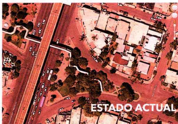
Imágenes de diagnóstico Para Sor Juana Inés de la Cruz

Al concluir el proyecto del primer punto se trabajo en propuestas conceptuales para los puntos con mas alta demanda de usuarios de la tarjeta feria que se localizan en el lado oriente de la Av. Universidad.