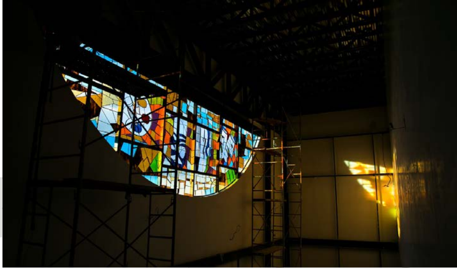
Imagen de vitral en edificio Rosa de los Vientos.

Los colores amarillo y naranja representan creatividad, calidez, animo, alegría y felicidad. El azul representa progreso, armonía. Y el Purpura representa el eclecticismo: las opiniones, estilos y carácter diverso que se concilia en una zona. Todos los colores armonizan con la gama que se representa en el vitral de la rosa de los vientos.