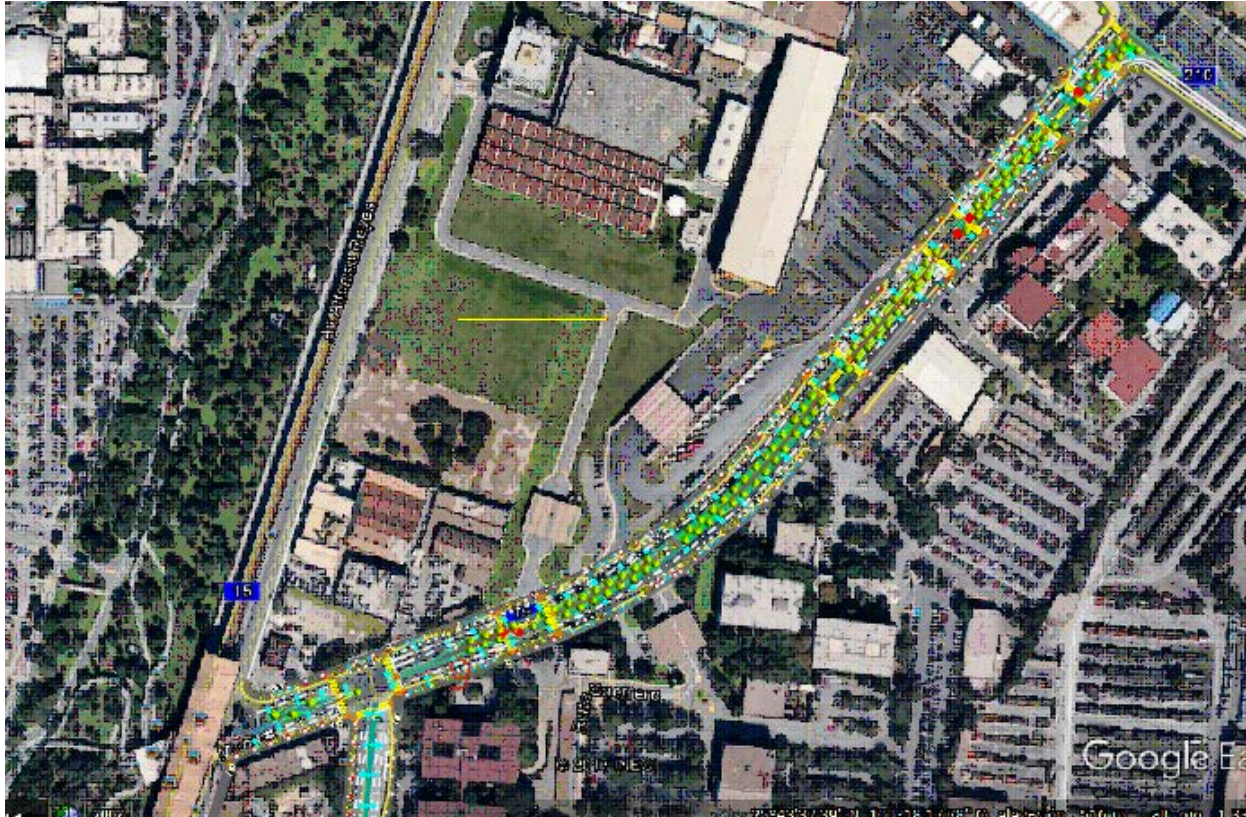
Imagen de proyecto en Calle Múnich

Dando seguimiento a la propuesta de la calle Múnich se fue resolviendo los últimos detalles del proyecto arquitectónico.