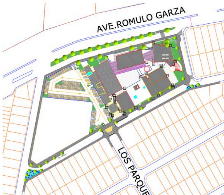
Imagen proyecto geométrico Rosa de los Vientos.

Se generó proyecto geométrico con las propuestas alrededor de la rosa de los vientos, con las estrategias antes mencionadas y cuantifico.