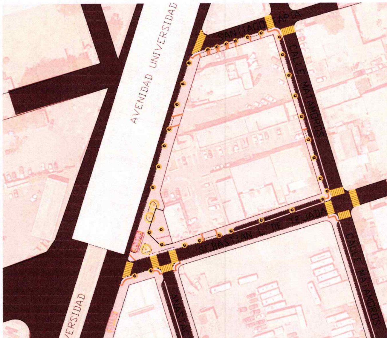
Imagen de proyecto geométrico parada Tapia.

En seguimiento de los proyectos para Av. Universidad se trabajaron las propuestas conceptuales ya expuestas, con las adecuaciones y mejoras acordadas en proyectos geométricos.