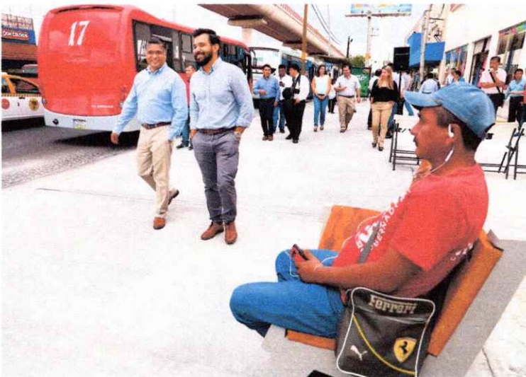
Imagen de intervención para urbanismo táctico

Se realizan propuestas para llevar a cabo esta intervención dentro de la semana de la movilidad y se opta por intervenir de una forma mas permanente y se inician trabajos para construir banquetas en donde antes se destinaban el espacio para estacionamiento ganando y mejorando espacio para el peatón y usuarios del transporte publico.