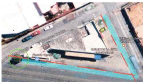
GRAL. FRANCISCO NARANJO CRUZ CON CUAUHTÉMOC AV. UNIVERSIDAD VISTA AÉREA