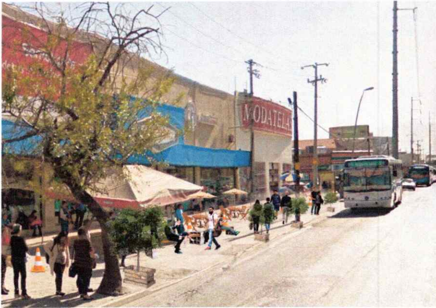
Imagen objetivo para urbanismo táctico

Posterior a los proyectos arquitectónicos puntuales en Av. Universidad y cuantificar estas intervenciones, se propone crear estrategias de urbanismo táctico en el punto ubicado entre las calles Gra. Bernardo Reyes y Gral. Nicolás Bravo en la parada "Julio Cepeda".