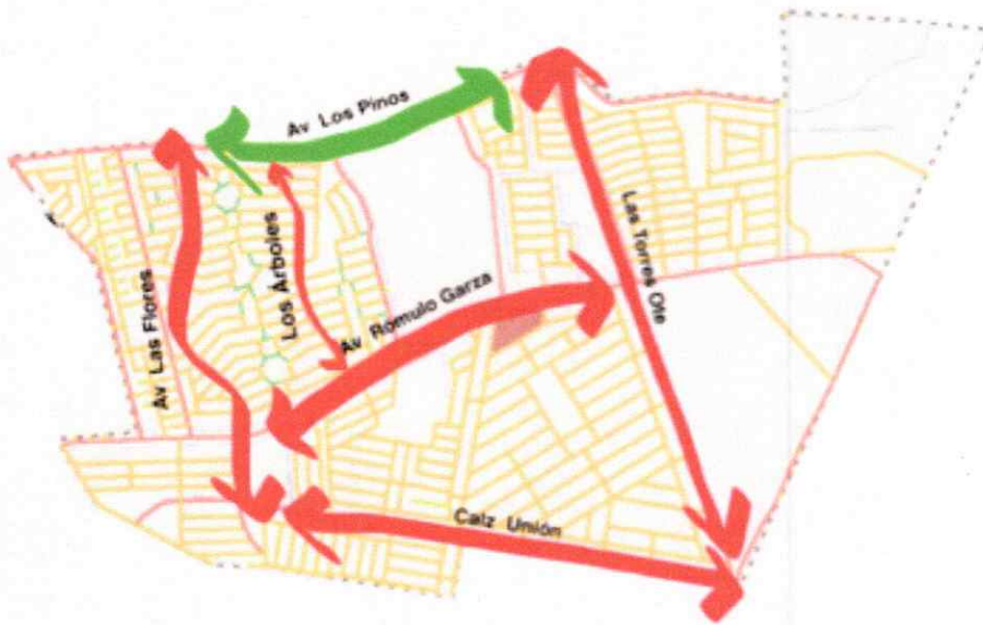
Imagen análisis urbano (vialidades a intervenir según estudio urbano).

Al concluir un diagnóstico, análisis urbano con propuestas conceptuales y espacios residuales en el entorno inmediato de la Rosa de los vientos, se propone una intervención de regeneración urbana para las vialidades que crean un circuito según el polígono de estudio urbano.