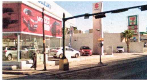
IMAGEN TOMADA DE GOOGLE MAPS 2017 AV. UNIVERSIDAD CRUCE CON CUAUHTÉMOC

NOTA: LA IMAGEN DE LA IZQUIERDA ES DEL AÑO 2014. ACTUALMENTE EN EL PREDIO SE ENCUENTRA UNA SUCURSAL SUZUKI, PERO LA BANQUETA PRESERVA LAS MISMAS CARACTERÍSTICAS